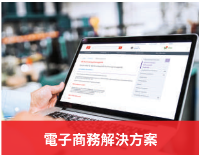
電子商務解決方案